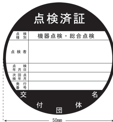
消火器以外の消防用設備等用