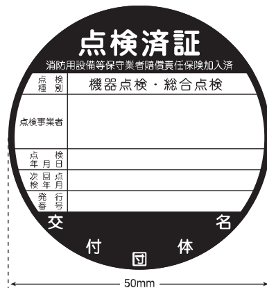
消火器以外の消防用設備等用